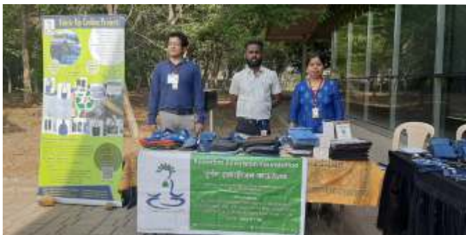
E-waste and plastic waste collection drive arranged by Mercedes Benz India