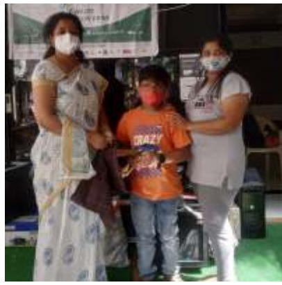
glimpses from E-Yantran