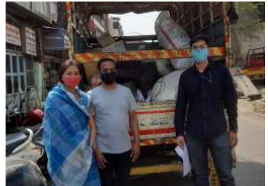
glimpses from PEHEL megadrive