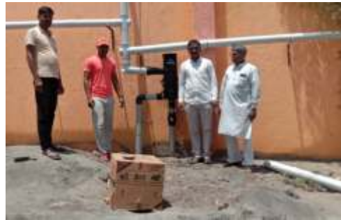
Rain Water Harvesting Units at Alsunde